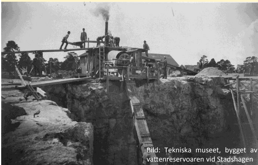
bygget av vattenreservoaren vid Stadshagen

Den branschrekommenderade kommunala gymnasieskolan Stockholms Byggtkniska i Kista stoppar intagningen inför höstterminen. Trots stort behov av kompetent arbetskraft inom bygg- och anläggningssektorn tar man inte in några elever i årskurs ett. Anledningen är för få sökande. LR-medlemmar som undervisar på skolan idag hamnar på utbildningsförvaltningens tillgångslista för matchning till annan skola inför kommande läsår. För lärare i de rena yrkesämnena kan det dock bli svårare med matchning. För plåtbranschen i Stockholm är det stoppade intaget problematiskt. Stockholms byggtkniska